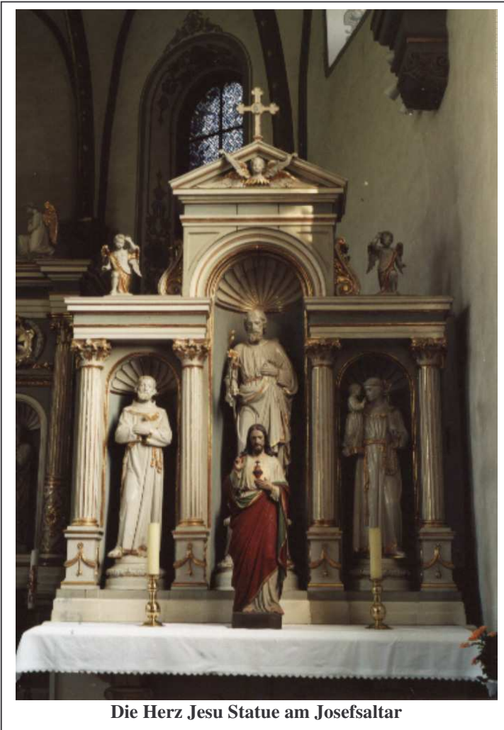
Die Herz Jesu Statue am Josefsaltar

der Erhöhung hinzu. Der Evangelist Johannes hatte geschildert, wie ein Soldat das Herz Jesu mit einer Lanze durchbohrte und Blut und Wasser herausgeflossen seien. Diesem Geschehen sagte man eine göttliche heilschaffende Wirkung nach: Das Blut des Herzens sei zur Erlösung der Menschheit geflossen und finde sich auch in der Eucharistie wieder. Das Wasser sei das der Taufe und habe durch die Getauften die Kirche errichtet. „Die Geburt der Kirche ist aus der Seite Christi erfolgt.“, heißt es in einer frühen Auslegung.