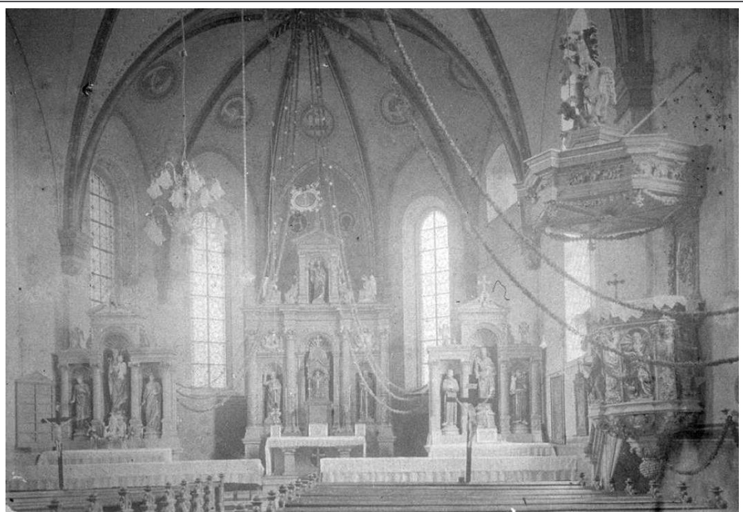
Innenraum der Pfarrkirche St. Margaretha um 1920

Rahmen für die ausgesetzte Monstranz darstellte. Eine der fein gedrechselten Säulchen hatte mittlerweile einen Liebhaber gefunden. Aber das Schicksal dieses Altarteils war schon damals endgültig entschieden. Statt seiner rückte die Kirchenpatronin Margaretha in die herausgehobene Stellung. Für diese Heilige, die sonst nur einen Wandplatz über dem linken Beichtstuhl inne gehabt hatte, bedeutete diese neue Position, in der sie sogar die Apostelfürsten Petrus und Paulus überragte, eine große Aufwertung.